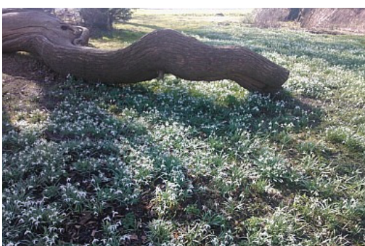
Het landgoed in voorjaarstooi.