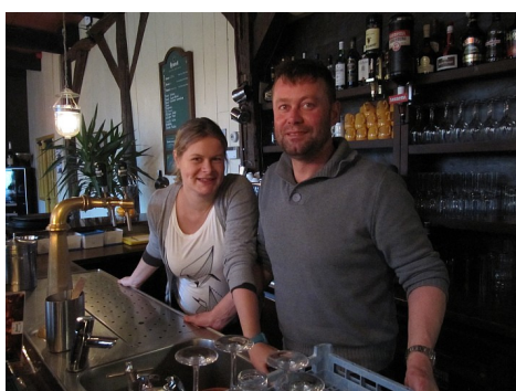
Exploitanten restaurant "de Boerderij".

Plaats van gesprek: restaurant "De Boerderij" landgoed Fraeylema te Slochteren.